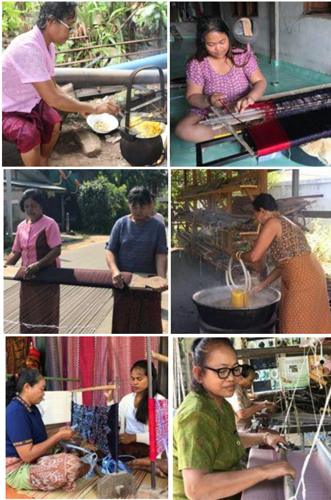
ภาพประกอบ 2 – 7 วิถีชีวิตช่างทอผ้าไหมตำบลสวาย อำเภอมืองสุรินทร์ จังหวัดสุรินทร์

การจัดการท่องเที่ยวของชุมชนผ้าไหมทอมือ ตำบลสวาย เริ่มขึ้นในปี พ.ศ.2560 แนวคิดในการจัดกิจกรรม การท่องเที่ยวเกิดจากความต้องการในการเพิ่มรายได้จากฐานทรัพยากรชุมชน โดยถึงแม้อาชีพหลักของคนในพื้นที่จะเป็นอาชีพเกษตรกรรม แต่กิจกรรมการทอผ้าไหมถือเป็นกิจกรรมหลักที่อยู่ในวิถีชีวิตและเป็นฐานเศรษฐกิจครัวเรือนของคน ในชุมชนที่ทำต่อเนื่องตลอดทั้งปี ที่ผ่านมานักท่องเที่ยวที่เข้ามาเที่ยวในชุมชนส่วนใหญ่เป็นกลุ่มนักท่องเที่ยวที่สนใจ วิถีชีวิตช่างทอ เป็นคณะศึกษาดูงานจากหน่วยงานราชการ องค์กรบริหารส่วนท้องถิ่น นักวิชาการและกลุ่มนักศึกษาที่สนใจกระบวนการทอผ้าไหมและการจัดการวิสาหกิจชุมชนทอผ้า รวมถึงมีกลุ่มนักท่องเที่ยวที่ชื่นชอบ สนใจซื้อผ้าไหมโดยตรงจากช่างทอในชุมชนซึ่งถือเป็นแหล่งผลิตโดยตรง การจัดการท่องเที่ยวของชุมชนผ้าไหมทอมือตำบลสวาย ดำเนินการโดยกระบวนการมีส่วนร่วมของคนในชุมชน ร่วมกันเป็นเจ้าของฐานท่องเที่ยวและร่วมจัดกิจกรรมการท่องเที่ยว มีภาคีเครือข่ายร่วม