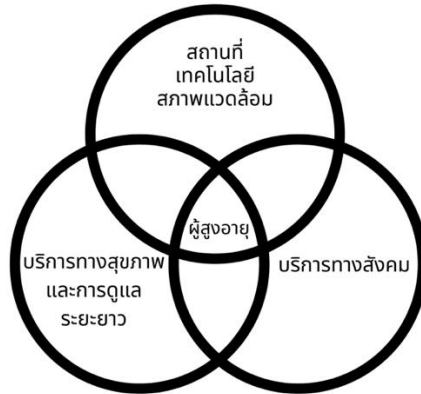
ภาพประกอบ 3 องค์ประกอบที่สำคัญของแนวคิดเรื่องการสูงวัยในที่อยู่อาศัยเดิม