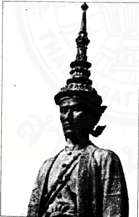
พระนารายณ์มหาราช

แบบของประวัติศาสตร์ในสกุลนี้ โดยพยายามชี้ให้เห็นว่าในปัจจุบันผ่านพ้นจากการสร้าง “รัฐประชาชาติ” แล้ว เพราะฉะนั้นประวัติศาสตร์ก็ควรจะเปลี่ยนรูปแบบด้วย และอิทธิพลทางประวัติศาสตร์จากสกุลตำราขนานภาพเป็นมรดกทางประวัติศาสตร์นิพนธ์ของนักเรียนประวัติศาสตร์ทุกคน ไม่ว่าเราจะชอบหรือไม่ชอบเพียงไรก็ตาม ดังนั้นจึงเป็นการไม่ฉลาด ถ้าจะทิ้งขว้างมรดกนี้ไปโดยมิได้ทำการวิพากษ์วิจารณ์ทั้งส่วนดีและส่วนที่บกพร่องของประวัติศาสตร์สกุลนี้ ในบทความชิ้นนี้ นิธิ ปฏิเสธวิธีการศึกษาประวัติศาสตร์แบบ “สิ่งที่ได้เกิดขึ้นจริง” (What actually happened) ของรังเก ในสกุลตำราขนานภาพและเขาก็เสนอวิธีการศึกษาประวัติศาสตร์แบบที่เรียกว่า (นิธิเป็นผู้เรียก) “วิพากษ์วิธทางประวัติศาสตร์” (เขาเรียกร้องให้นักประวัติศาสตร์เคร่งครัดกับวิธีการนี้ ใน “การศึกษาประวัติศาสตร์ไทย: อดีตและอนาคต” แต่อธิบายถึงวิธีการ “วิพากษ์วิธทางประวัติศาสตร์” ใน “ประวัติศาสตร์และกรวิจยทางประวัติศาสตร์”) โดยจะต้องเข้าไปถึงคำถามที่ว่า “มีหลักฐานอะไรอยู่บ้างจริงๆ และหลักฐานนั้นๆ หมายความว่าอะไรจริงๆ” ๑๓ นอกจากนั้นเขาก็ได้เสนอวิธีการศึกษาประวัติศาสตร์ที่เขาเชื่อว่าถูกต้อง ในรูปที่ว่าผู้ที่ศึกษาจะต้องรู้จักจัดการกับข้อมูลที่ได้รับจากแหล่งต่างๆ อย่างรอบคอบและสร้างสรรค์