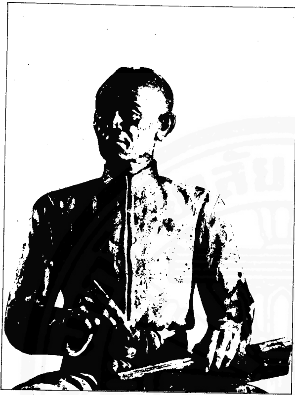
สุนทรภู่

นพมาศเห็นในสมัยนั้น คือ รัฐที่เท่าเทียมกันจำนวนมาก ตั้งอยู่มีได้มีเพียง “เขาพระสุเมรุ” ซึ่งเป็นรัฐตั้งเป็นศูนย์กลางให้รัฐอื่น ๆ มาแวดล้อม, อิทธิพลของวิชาศาสตร์ตะวันตกเข้ามาเผชิญหน้ากับค่านิยมในสังคมเก่าผู้แตงนางนพมาศอยู่ในกระแสร่างแห่งการเปลี่ยนแปลงด้านโลกทัศน์ด้วย ซึ่งเขาต้องแสดงปฏิกริยาโต้ตอบ นิธิให้ข้อสังเกตอย่างหนึ่งในงานชิ้นนี้ คือ ในทางประวัติศาสตร์ความคิดเรื่องนพมาศเป็นตัวเชื่อมไตรโลกวินิจฉัยให้ต่อกับแสดงกิจจานุกิจได้อย่างดี แสดงให้เห็นถึงพัฒนาการทางความคิดของปัญญาชนไทย โลกของนางนพมาศจึงเป็นโลกที่สำคัญเชื่อมโยงยุครัตนโกสินทร์ให้สืบเนื่องกับยุค “ปฏิรูป”