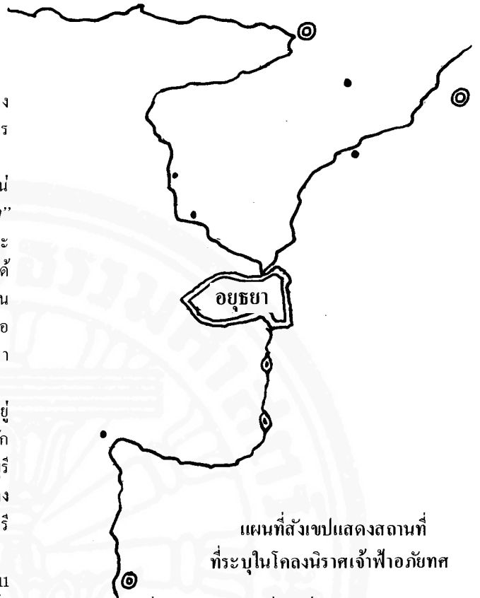
แผนที่สังเขปแสดงสถานที่ที่ระบุในโคลงนิราศเจ้าฟ้าเอกทัศ

ประการที่ห้า ในโคลงบทที่ 24 ซึ่งควรจะเป็นโคลงสุดท้ายปงไว้ว่า จำนวนโคลงชุดนี้มี 9 บทเท่านั้น แม้ว่าจะตัดโคลงที่หลงเข้ามาดังที่ได้กล่าวแล้วจำนวน 9 โคลงแล้ว ก็ยังคงเหลืออยู่ถึง 15 โคลง ถ้าจะตัดลงอีกก็ต้องเป็นโคลงที่เกี่ยวกับการบนบาลศาลก่าว คือ บทที่ 18, 19, 20, 22, 23 ซึ่งจะพอดีถ้าไม่นับเอาโคลงบทที่ 24 เข้ารวมใน 9 บทดังกล่าวด้วย