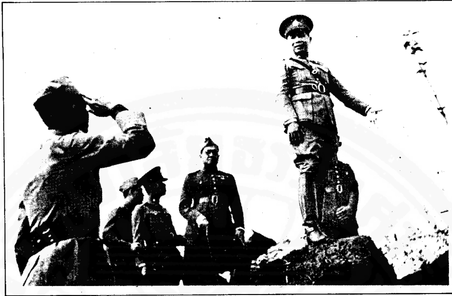
ท่านผู้บัญชาการทหารสูงสุดตรวจดูที่มั่นของข้าศึก ณ ปอยเปต ซึ่งกองทัพพรพเข้ายึดได้

ได้ว่าจอมพลป.มีความเห็นว่า ถ้าไม่ยอมให้กองทัพญี่ปุ่นผ่าน อาจจะมี เกิดผลดังนี้ คือ 33