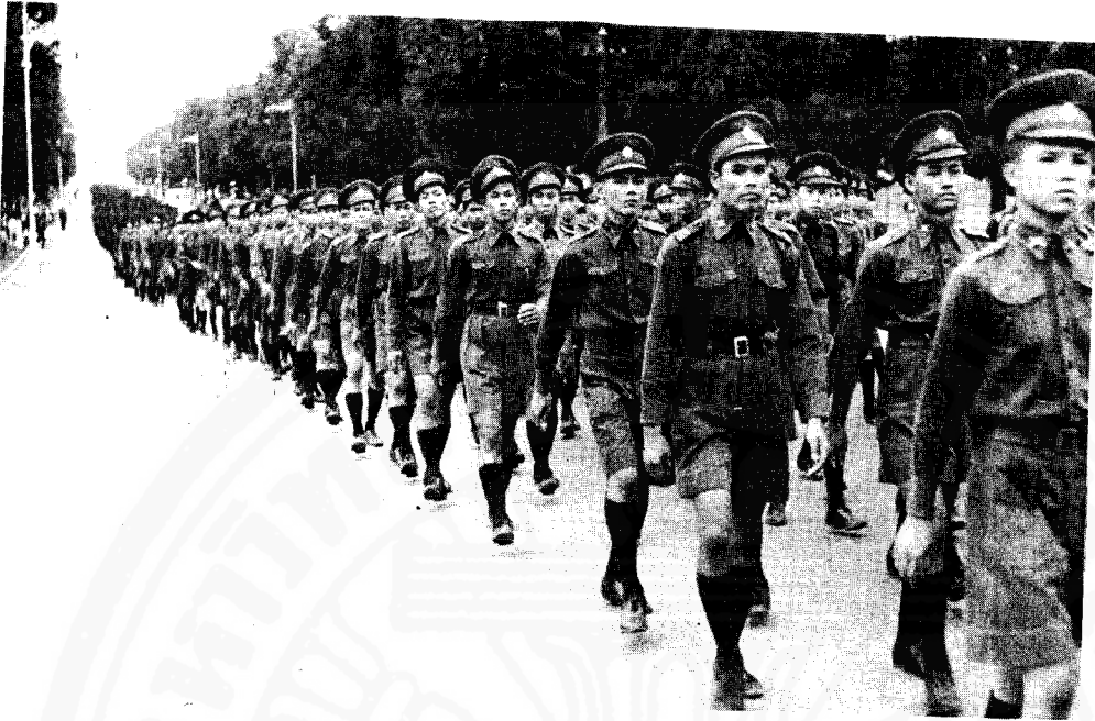
ต้อนรับยุวชน ใหม่ พ.ศ. 2482

จนความรู้สึกเรื่องนี่กลายเป็นมติมหาชน ซึ่งนับว่านี่ก็เป็นความสำเร็จอีกเรื่องหนึ่งในการสร้างลัทธิชาตินิยม ทั้งนี้ เพราะ “แม้ว่าจะมีผู้ไม่เห็นด้วย เพราะไม่เห็นความจำเป็นที่จะต้องไปเรียกเอาดินแดนเหล่านั้นคืนมาให้เป็นการปกครองเพิ่มขึ้น เนื่องจากดินแดนที่มีอยู่แล้ว รัฐบาลยังไม่สามารถที่จะทะนุบำรุงให้มีความเจริญทั่วถึงได้ การเรียกร้องเอาดินแดนคืนจากฝรั่งเศสเป็นมติมหาชนไปเสียแล้ว ถ้าใครขึ้นคัดค้านก็อาจเป็นคนไม่รักชาติ” 7