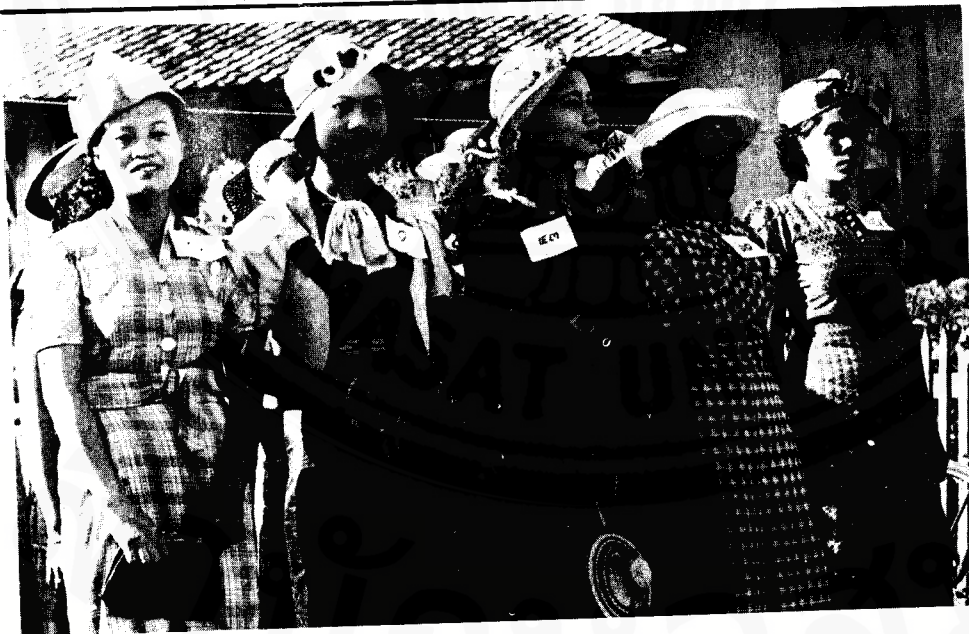
การประกวดมหากษัตริย์ อุบลราชธานี 28 สิงหาคม พ.ศ. 2484

อย่า พูดเรื่องการรบ พูดความลับทางทหาร พูดเรื่องที่ไม่เป็นมงคล แก่บ้านเมืองของเรา