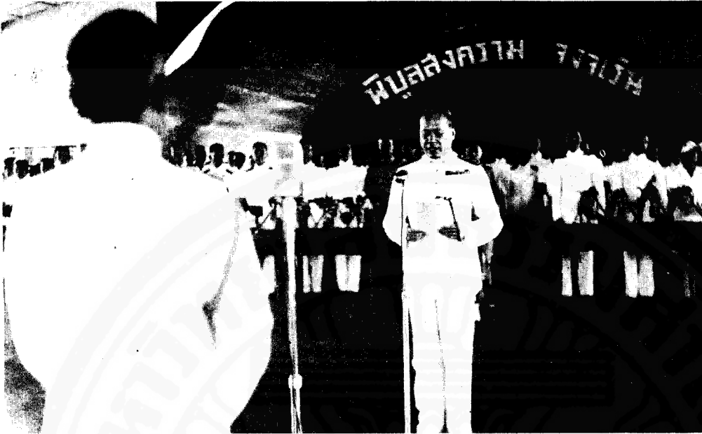
วันเกิดนายกรัชมุนตรี 14 กรกฎาคม พ.ศ. 2486