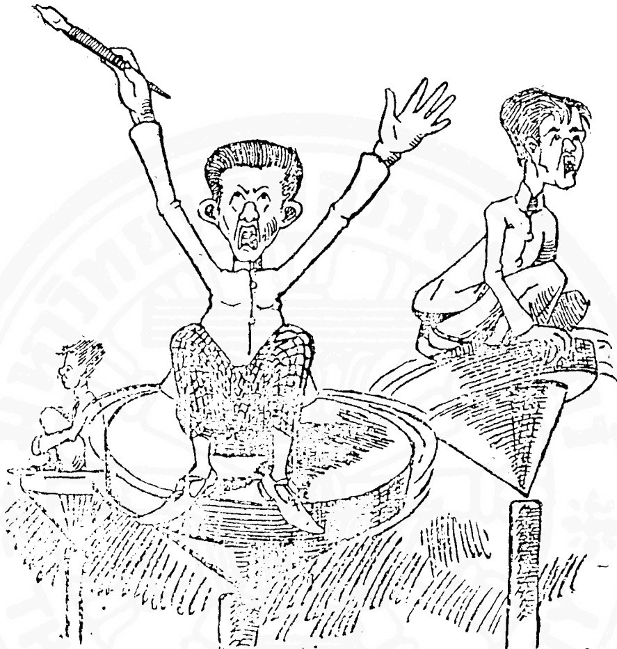
บทกวี "บางกอกกาวเมียง" ของผู้เขียนที่มีชื่อไม่ขอ อนุญาติให้รกรกษณ์บางกอกกาวเมียง

ในประเด็นที่สาม การพิจารณาเกี่ยวกับเรื่องการใช้อำนาจของเจ้าพนักงานและเสนาบดี กล่าวคือพระราชบัญญัติฉบับนี้ได้ให้อำนาจในการพิจารณาอนุญาตตลอดจนการอนาโบนอนุญาตและการปิดโรงพิมพ์แก่สมุหเทศาภิบาลมณฑลโดยมีหลักในการวินิจฉัยในเรื่องนี้สำคัญแห่ง "ความสงบราบคาบของประชาชน" โดยอาศัยดุลพินิจของเจ้าพนักงานและผู้มีอำนาจ ฉะนั้นในทางปฏิบัติแล้วผลแห่งการพิจารณาจึงเป็นเรื่องที่ขึ้นอยู่กับความคิดเห็นหรือทัศนคติของผู้มีอำนาจมากกว่าหลักการที่สามารถเชื่อถือได้ ประกอบกับในมาตราที่ 12 แห่งพระราชบัญญัตินี้ได้ให้อำนาจแก่เสนาบดีกระทรวงมหาดไทยแต่งตั้งเจ้าพนักงานเข้าไปตรวจตราสถานที่ของบุคคลที่ได้รับอนุญาตหรือไม่ได้รับอนุญาตได้ในกรณีเห็นว่ามีความผิดอันชวนสงสัย และในมาตราที่ 10 นั้นระบุว่าคำสั่งของสมุหเทศาภิบาลบังคับได้ทันทีโดยไม่ต้องรอคอยคำ