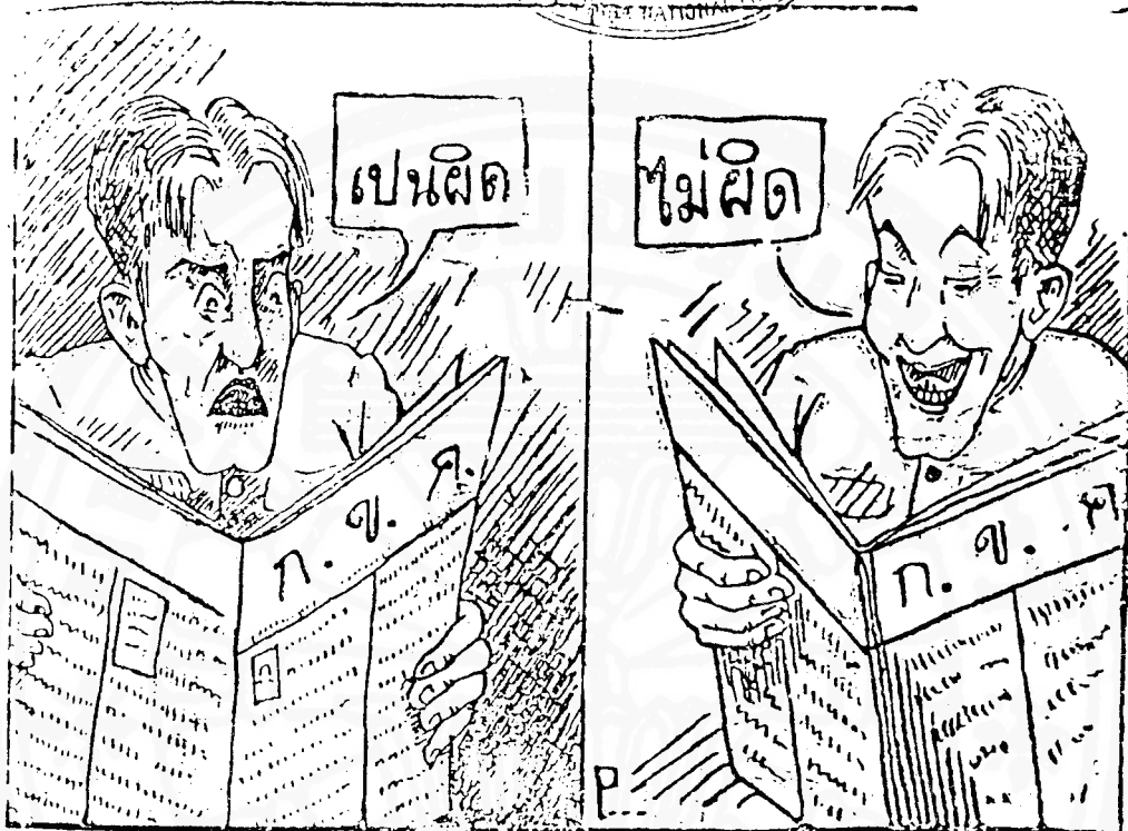
หนังสือพิมพ์คนไทย