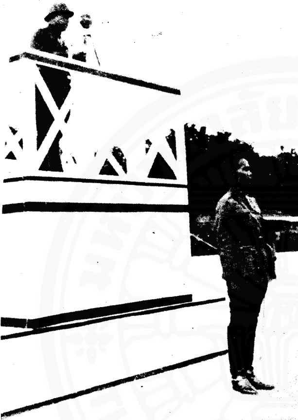
พันเอกพระยาพลพลพยุหเสนา กำลังกล่าวสดุดี วีรกรรมของทหารตำรวจที่เสียชีวิตในกรณี ปราบกบฏเมื่อ 30 พฤศจิกายน 2476 มีพันโท หลวงพิบูลสงคราม ผู้อำนวยการปราบกบฏขึ้น อยู่บนยกพื้นด้านหน้า