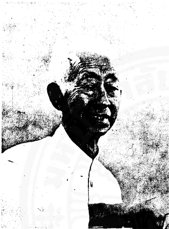
ม.จ.สิทธิพร กฤดากร

อยู่หัว (21) และ พระบาทสมเด็จพระเจ้าอยู่หัวทรงดำรงพระองค์เป็นกลางในตลอดระยะเวลาวิกฤตการณ์ (22)