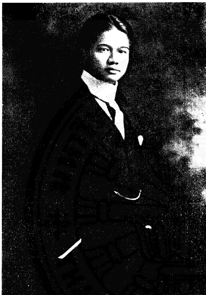
พระยาโทณวนิกมนตรี

ถ่ายขณะกำลังศึกษาอยู่ในนครอชิงตัน สหรัฐอเมริกา เมื่ออายุ 21 ปี