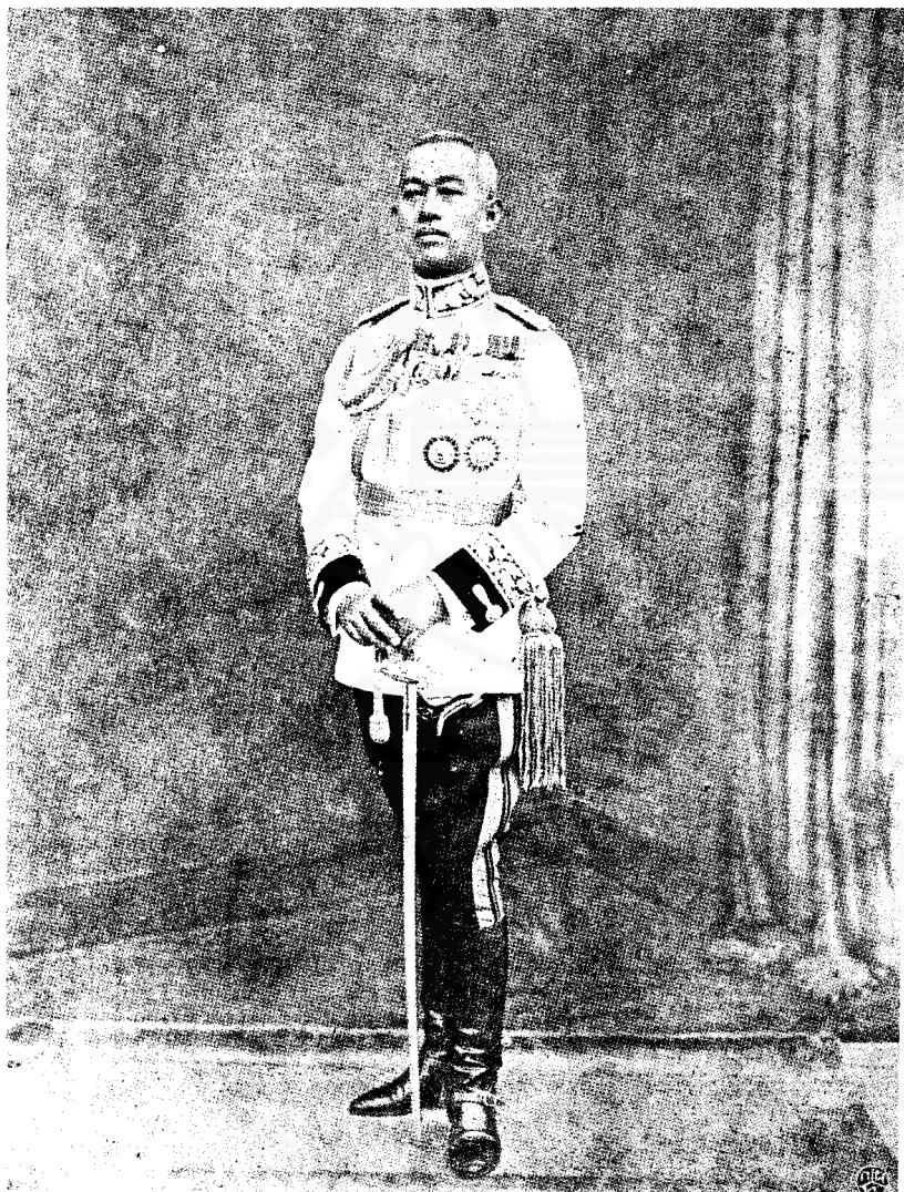
พลเอก พระวรวงศ์เธอ พระองค์เจ้าบวรเดช กฤดากร หัวหน้าผู้ก่อการ พ.ศ. 2476

เรียงประวัติศาสตร์ให้เป็นอย่างที่มีนัยเกิด ขึ้นอย่างสมบูรณ์เท่าที่จะทำได้