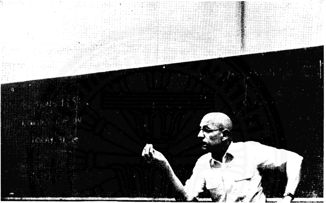
Michel Foucault. (1926–1984)

นั้นได้ขยายฐานตัวเองออกไปสู่ตลาดในวงกว้าง นอกเหนือจากวงวิชาการแคบ ๆ เป็นอยู่ ด้วยลักษณะความจำเป็นของสังคมนั้นได้ทำให้ “เจตนาธรรมณ์ที่มุ่งสู่ความเป็นจริง” มีความสำคัญมากขึ้น จึงทำให้พฤติกรรมในการพูดแบบจริงจังนั้นได้ถูกลดทอน และทำให้คนทั่วไปเข้าใจได้ (popularize) ด้วยรูปแบบที่ง่ายขึ้นเพื่อสะดวกในการถ่ายทอด 24 อย่างไรก็ตามลักษณะของการ