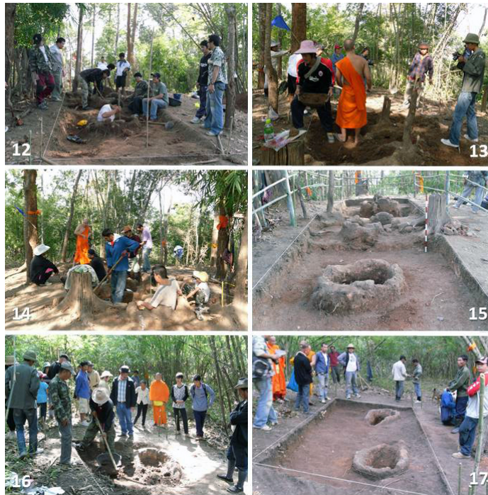
ภาพประกอบ 12-13-14-15-16-17 การขุดค้นแหล่งโบราณคดีดอยวงเมื่อวันที่ 20-23 มกราคม 2554 ในรูปแบบการทำงานโบราณคดีชุมชน โดยทำการขุดค้นศึกษาจำนวน 2 หลุม

ระหว่างการทำงานขุดค้นศึกษาทั้ง 3 วัน มีพระสงฆ์ ชาวบ้านและประชาชนในตำบลป่าแดด และตำบลอื่น ๆ ของอำเภอแม่สรวยและจากอำเภออื่น ๆ ในจังหวัดเชียงรายเดินทางขึ้นไปร่วมกิจกรรมเป็นจำนวนมาก มีการพูดคุย วิเคราะห์ วิชาภกษเกี่ยวกับหลักฐานไถดินและโบราณวัตถุที่ขุดพบกันอย่างสนุกสนาน บางกลุ่มก็สนใจเรื่องเหล็กไหล เรื่องเครื่องรางของขลัง