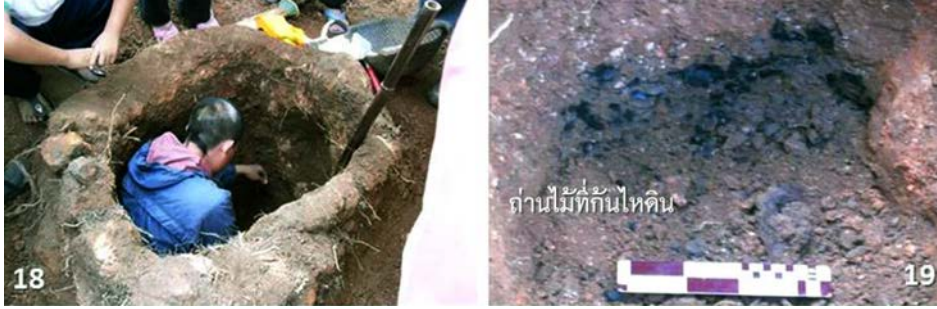
ภาพประกอบ 18-19 การขุดค้นภายในหลุมไหดินใบหนึ่ง ในหลุมขุดค้นบนยอดดอย พบกองถ่านไม้อยู่ที่ก้นหลุม ถ่านไม้ที่พบเป็นหลักฐานบ่งชี้ว่าผนังของหลุมไหดินที่พอกด้วยโคลนดินเหนียวถูกเผาจากภายในจนเนื้อดินสุกเป็นสีอิฐ