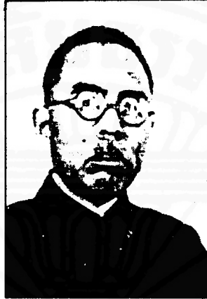
เอกอัครราชทูต ชิโอบาคามิ