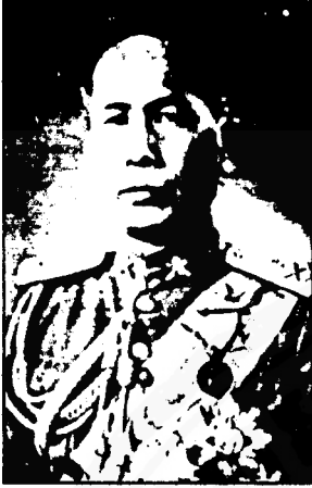
จอมพล ป. พิบูลสงคราม