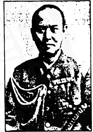
พันเอก ทามูระ อิโรชิ ทูตทหารญี่ปุ่น ประจำกรุงเทพฯ