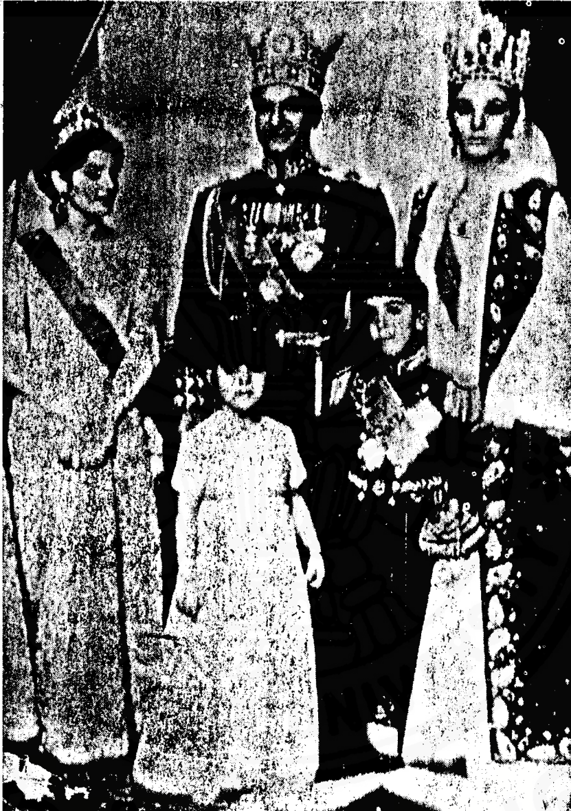
จากซ้ายไปขวา:เจ้าหญิงชานซ์ ราชธิดาจาก มเหสีองค์แรก, เจ้าหญิงฟารานซ์, โมฮัมเมต เรชา ฮาน์, มกุฎราชกุมารเรชา, พระนางฟาราน์ เมื่อ ค.ศ.1987