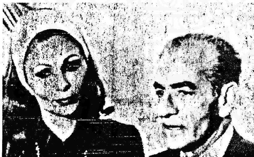
อดีตพระเจ้าชาห์โมฮัมเหม็ด เรซา และชายา