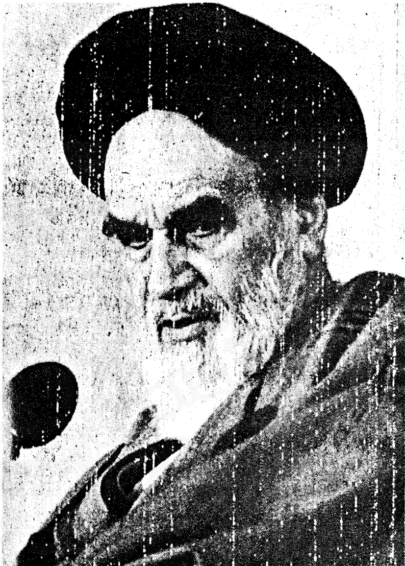
อะยาตุลลอฮ์ รุซูลลอฮ์ โคมัยนี