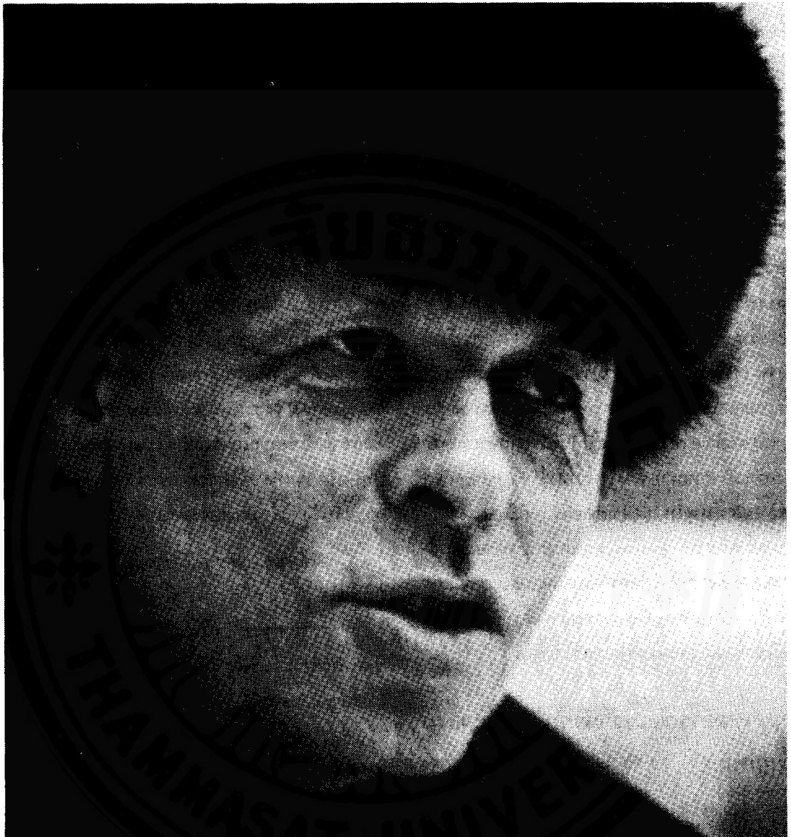
ภาพที่ 3 นายซาคารอฟ

นาย ซาคารอฟ (Sakharov) เมื่อปัญญาชนถูกปิดปากด้วยวิธีการต่าง ๆ เช่น ส่งเข้าโรงพยาบาลโรคจิต หรือถูกจำกัดบริเวณให้อยู่ภายในบ้าน ชาวตะวันตกในโลกเสรีก็แสดงความเห็นอกเห็นใจ เช่น มอบรางวัล