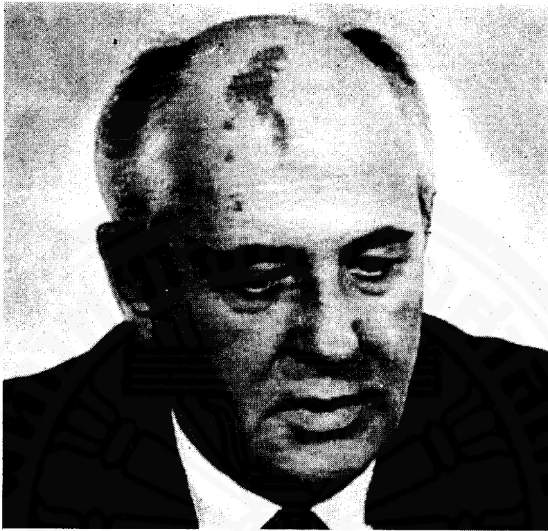
ภาพที่ 5 นายกรัฐมนตรี

ตั้งนับตั้งแต่การรัฐประหารเมื่อเดือนสิงหาคม ค.ศ. 1991 อำนาจของนายกรัฐประหารก็ลดลงอย่าง ชวบชาบ อำนาจของพรรคคอมมิวนิสต์ก็ลดลงตาม ไปด้วย การรัฐประหารที่ล้มเหลวครั้งนั้นนับเป็นปัจจัย สำคัญอันหนึ่งที่น่าไปสู่สวนมานเหล็ก