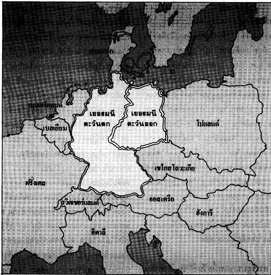
ภาพที่ 4 แผนที่แสดงเยอรมันตะวันตกและเยอรมันตะวันออก

ไปยังกลุ่มประเทศในโซเวียตบอลคัรบซึ่งขานรับอย่างเต็มใจ ฮังการีเป็นประเทศต่อมาจากโปแลนด์ที่หันหลังให้ลัทธิคอมมิวนิสต์และพยายามเป็นประชาธิปไตยแบบสังคมนิยม ในเดือนมีนาคม ค.ศ. 1988 ฮังการีได้เลิกปิดกั้นชายแดนส่วนที่ติดกับออสเตรีย ตั้งแต่นั้นมาชาวเยอรมันตะวันออกก็หลั่งไหลเข้าสู่ เชกโกสโลวะเกีย ซึ่งมีชายแดนติดต่อกับเยอรมันตะวันออก จากนั้นก็เข้าสู่ ฮังการี ออสเตรีย และ เยอรมันตะวันตก ตามลำดับ การที่ชาวเยอรมันตะวันออกได้หลั่งไหลเข้าสู่เยอรมันตะวันตกเป็นจำนวนมากโดยไม่ต้องผ่าน กำแพงเบอร์ลิน ที่เคยเป็นทางเดียวที่อาจหลบหนีเข้าสู่เยอรมัน-