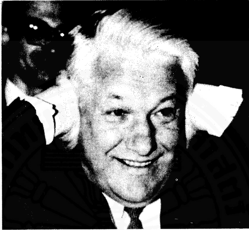
ภาพที่ 6 นายเยลชิน

บาทซอฟเกือบหมดอำนาจ นายเยลชินจึงทำตนเป็นผู้นำ และชักชวนสาธารณรัฐเชโกสโลวาเกีย ได้แก่ สหพันธ์รัสเซีย (สหพันธ์รัฐรัสเซีย) เบลารุส (ไบโรลุสเซีย) และยูเครน รวมกันก่อตั้งเป็น เครือจักรภพแห่งรัฐเอกราช (Commonwealth of Independent States) เมื่อวันที่ 8 ธันวาคม ค.ศ. 1991 โดยประกาศว่าสหภาพโซเวียตหมดสิ้นสภาพแล้ว การลงนามก่อตั้งครั้งนี้เป็นเสมือน “มรณบัตร” ของสหภาพโซเวียต (Time, Dec. 23, 1991 : 11)