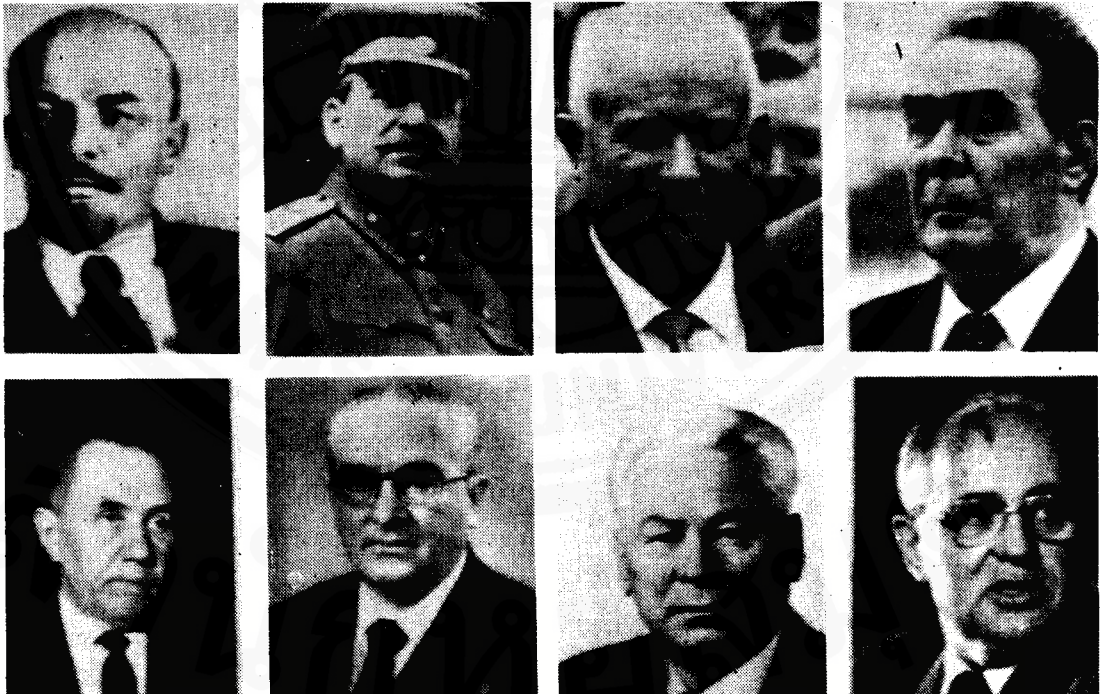
ภาพที่ 2 ผู้นำสหภาพโซเวียต 8 คน แถวบน (ซ้ายไปขวา) เลนิน สตาลิน ครุชชอฟ เบรชเนฟ แถวล่าง (ซ้ายไปขวา) โคซีกิน อันโดรปอฟ เซอร์เนนโก กอร์บาชอฟ