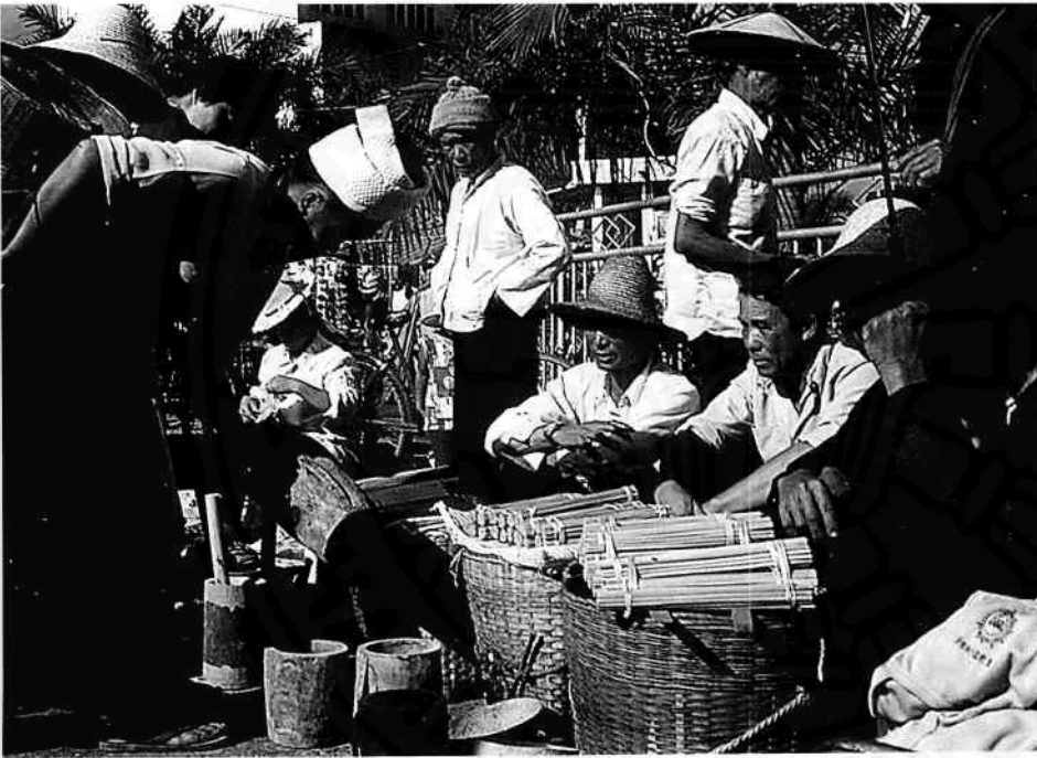
ตลาดนัดเมืองขอน

เทียบกับรายได้ของกรรมกร และมีหน้าซ้าเกษตรกรยังมีอาหารอุดมสมบูรณ์กว่า เพราะว่าไม่ต้องไปซื้อ อย่างบ้านหลักข้าง ทุกบ้านมีรถอีแต่น ที่เขาใช้ขับไปในเมือง มีหัวรถไถทุกคน แต่ทุกบ้านมีควายนะครับ พอดีในช่วงที่ไป เขากำลังไถนาอยู่ ก็ถามเขาว่า ทำไมเขาไม่ใช้หัวรถไถเนี่ยไถนา เพราะว่าผมก็เคยชินกับภาพที่เห็นในบ้านเรา กับการใช้หัวรถไถไถนา ชาวบ้านที่นั่นเขาก็ตอบผมบอกว่า แล้วจะให้เขาเอาควายไปทำอะไร ตอนแรกผมก็นึกว่าคนที่ตอบผมเนี่ยคงกวนผม แต่พอผมยิงคำถามนี้กับหลายๆบ้าน ปรากฏว่าตอบแบบเดียวกันหมดเลย ผมรู้สึกว่าเขามีความผูกพันกับควาย