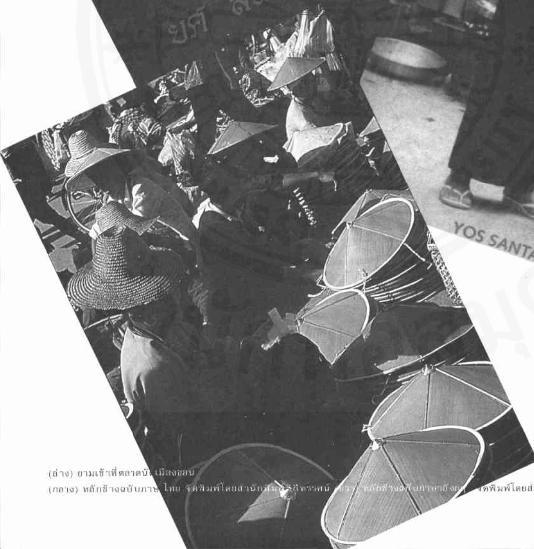
(ซ้าย) ยามเช้าที่ตลาดน้ำ เมืองชลบ (กลาง) หลักช้างฉบับภาษาไทย จัดพิมพ์โดยสำนักพิมพ์วิบูลย์กิจ (ขวา) หลักช้างฉบับภาษาอังกฤษ จัดพิมพ์โดยสำนักพิมพ์ silkworm.