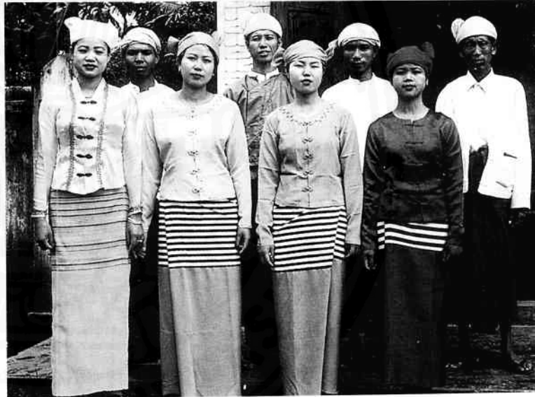
ไทหลวงในรัฐกะฉิ่น สภาพพม่า

ในการที่จะแสวงหาพื้นที่ทางวัฒนธรรมให้แก่ตัวเอง ภายในบริบทของพหุสังคมที่ตัวเองเป็นองค์ประกอบอยู่ เพราะฉะนั้นจะเห็นว่าในขณะที่ไทอาหม แล้วก็ไทใหญ่ เป็นกลุ่มที่ค่อนข้างจะคึกคักเข้มแข็งมาก ในแง่ของการเคลื่อนไหวทางวัฒนธรรม เพื่อจะสร้างหรือว่านิยามความหมายทางชาติพันธุ์ของตัวเองนะครับ แสดงให้เห็นการดำรงอยู่อย่างมีความหมายของตัวเอง โดยสัมพันธ์กับวัฒนธรรมกระแสหลักที่ไม่ใช่ไท แต่ว่าคนไทยกลุ่มอื่น ๆ อย่างเช่นไทคำตี้ก็ดี หรือว่าไทหลวงในรัฐกะฉิ่นก็ดี กลับอยู่ในสถานะที่ passive ค่อนข้างมากเปรียบเทียบกับสองกลุ่มที่พูดมา