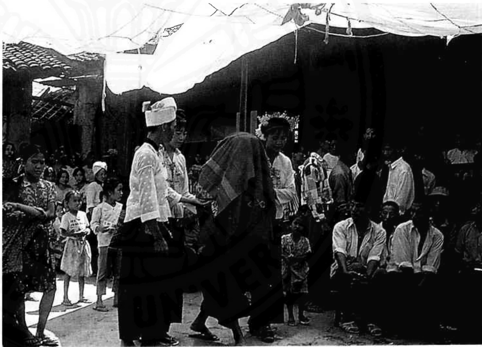
สาวฮับประคองเจ้าสาวออกมาไหว้สับบรรพบุรุษ

บ้านมันไม่มีพื้นที่ที่จะตั้งได้ เพราะฉะนั้นจะต้องเอาเตาเอาอะไรต่าง ๆ ออกมาสร้างเป็นเพิงชั่วคราวเพื่อทำกับข้าวกันนอกบ้าน ในบ้านมันทำไม่พอ ใช้คนประมาณ 20 คนในการทำกับข้าว แล้วสภาพภายในบ้านนะครับ จะตั้งโต๊ะประมาณสัก 30 โต๊ะ แล้วก็ตั้งแต่ 7 โมงเช้า 8 โมงเช้าก็จะมีคนทยอยมากินเรื่อยๆตามอาวุโสใครที่มีอาวุโสมากก็จะได้กินก่อน แล้วเมื่อโต๊ะหนึ่งลุดไป อีกกลุ่มใหม่ก็จะเข้ามาแทนทันที เขาจะเปลี่ยนกับข้าวแล้วก็เสิร์ฟตลอดประมาณ 18 ชั่วโมง ตั้งแต่เข้ายันมืด พวกหนุ่มๆที่ไม่มีอะไรทำก็จะนั่งกินเหล้าตั้งแต่เข้ายันมืดอีกเหมือนกัน