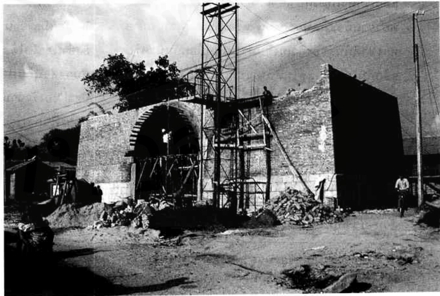
ประตูเมืองมาว

ผมกลับไปดูวังของเจ้าเสื่อข่านฟ้า หอเจ้าฟ้าเมืองมาวเนี่ยเนครับ ซึ่งชาวบ้านบอกว่า เจ้าเสื่อข่านฟ้าก็เคยอยู่ตรงนี้ ตอนนั้นมันเหลือเสาอยู่สองต้นเนครับ แล้วก็ยังมีหลังคาเก่า ๆ อันหนึ่ง แล้วคนจีนก็ไปสร้างประตูเมืองอยู่หน้าหอ ซึ่งเป็นหอเก่า ๆ แล้วก็มียูปลิงโตแบบประตูจีนปรกติทั่วไปตั้งตระหง่านอยู่เนครับ ซึ่งคนไทก็ไม่ได้สนใจอะไร แต่ผมคิดว่าในแง่ของสัญลักษณ์ มัน