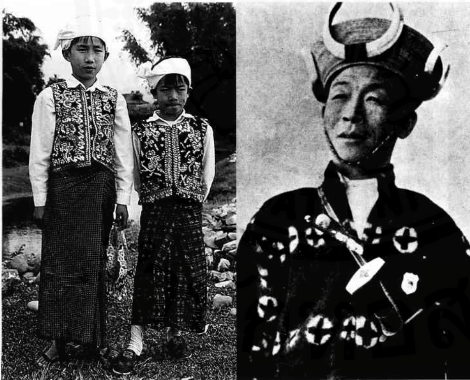
(ซ้าย) ไทคำตี้ ที่เมืองปุตตาโอ (ขวา) กระวาน

จะใช้ทฤษฎีของลีซไปสวมเข้ากับปรากฏการณ์จริงได้อย่างพอเหมาะพอสมในทุกกรณี ประเด็นสำคัญตรงนี้ก็คือ ผมคิดว่าบางทีเราต้องการชุดคำอธิบายที่มีพลังอธิบายสาเหตุของความหลากหลายของศักยภาพในการปรับตัวของกลุ่มชาติพันธุ์ ตลอดทั้ง range of variation นะฮะ ไม่ใช่เฉพาะที่ extreme ใด extreme หนึ่ง ตรงนี้ผมอยากเปิดเป็นประเด็นอภิปรายไว้ประเด็นหนึ่ง เพราะอาจารย์ยศก็ใช้ทฤษฎีของลีซในงานของท่านด้วย