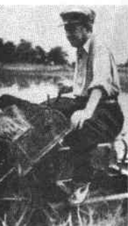
ur avec la machine piquage de riz dans commune oculaire