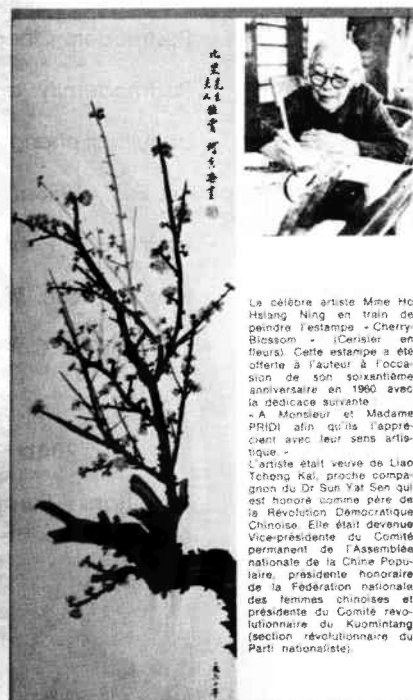
此畫是 名畫家 何香凝 畫的

La célèbre artiste Mme Ho Hsiang Ning en train de peindre l'estampe - Cherry Blossom - (Cerisier en fleurs). Cette estampe a été offerte à l'auteur à l'occa- sion de son soixantième anniversaire en 1960 avec la dédicace suivante - A Monsieur et Madame PRIDI afin qu'ils l'appre- cient avec leur sens artis- tique - L'artiste était veuve de Liao Tchong Kai, proche compa- gnon du Dr Sun Yat Sen qui est honoré comme père de la Révolution Démocratique Chinoise. Elle était devenue Vice-présidente du Comité permanent de l'Assemblée nationale de la Chine Popu- laire, présidente honoraire de la Fédération nationale des femmes chinoises et présidente du Comité révolutionnaire du Kuomintang (section révolutionnaire du Parti nationaliste).