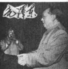
leur avec Mao Tsé-toung.